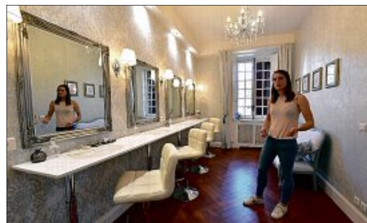
À ALLILLAC. La transformation de cette chambre en une loge de maquillage pour la mariée et ses demoiselles d'honneur a été filmée par Channel 4.

L'émission de télé-réalité s'appelait au départ simplement Escape to the chateau et suivait les aventures d'un couple de Britanniques qui rénove un château dans la Mayenne, de l'achat des lieux à leur transformation. Devant le succès du programme, Channel 4 a décidé de suivre d'autres propriétaires de châ-