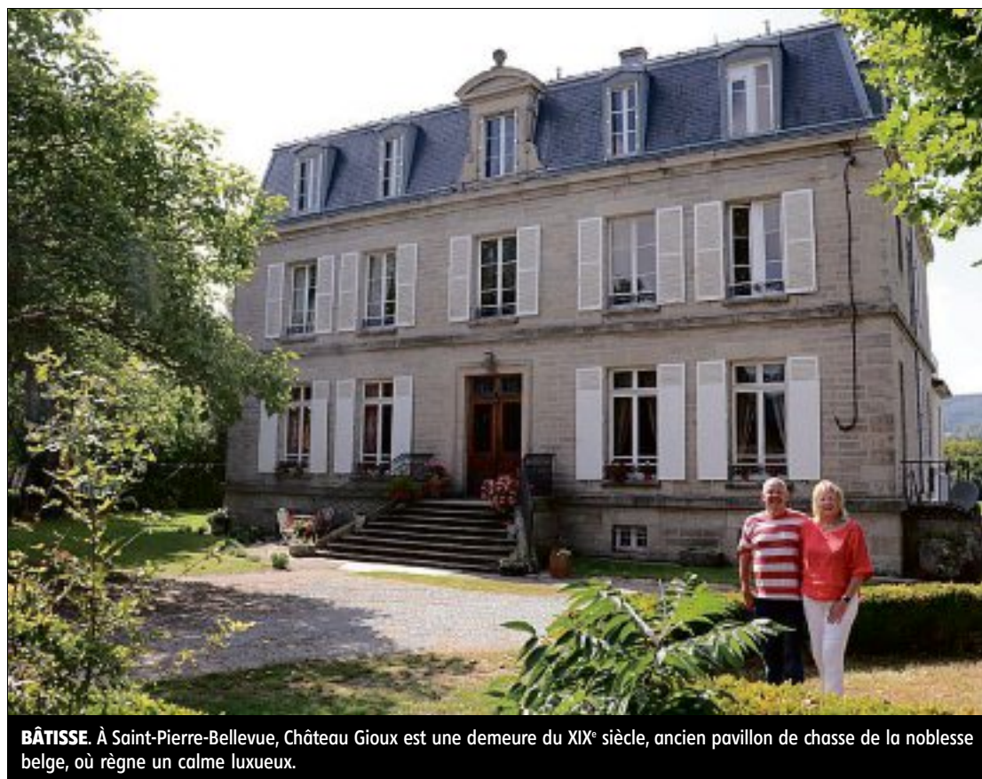
BÂTISSE. À Saint-Pierre-Bellevue, Château Gioux est une demeure du XIX e siècle, ancien pavillon de chasse de la noblesse belge, où règne un calme luxueux.